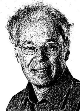
Ludwig Gärtner Stellvertretender Direktor des Bundesamts für Sozialversicherungen

Im Juni 2010 hat der Bundesrat zwei nationale Jugendschutzprogramme zur Gewaltprävention und zur Verbesserung des Jugendmedienschutzes lanciert. Er reagierte damit auf zunehmende Gewalt im öffentlichen Raum, in der Schule und im Internet und die wachsende öffentliche Besorgnis bezüglich der Gefahren, denen Minderjährige bei der Nutzung digitaler Medien ausgesetzt sind.